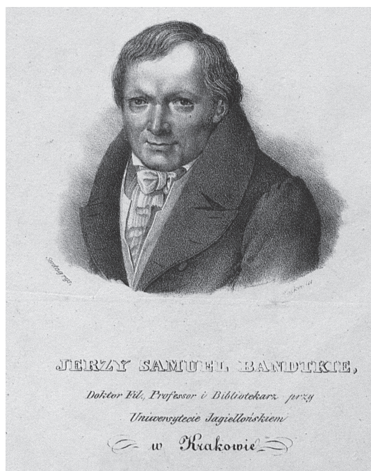
Fig. 2. Jerzy Samuel Bandtkie (1768–1835), librarian in the Jagiellonian Library, author of publications of many finds of Roman coins from the Kraków region.

Cataloguing ancient coin finds, including Roman coins, was also among the main research tasks of the Department of Numismatics, established in 1969 within the JU Chair of Oriental Studies, and renamed in 1972 as the Laboratory of Oriental Sources and Numismatics of the