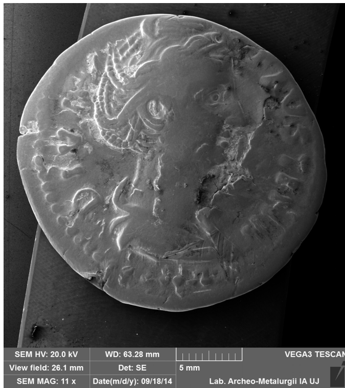
Fig. 9. Examination of chemical composition using EDS method – example of the denarius of Faustina the Elder (148–161 AD).

evidence of cultural and social transformations which took place in the territory of present-day Poland in antiquity. The issue in question features in books and papers published by the Institute staff and is addressed in conferences held at international and national levels, and the results are regularly presented during the meetings of the Numismatic Section of the Archaeological Commission (PAS, Kraków branch) and recapitulated during the annual conference held at the Institute of Archaeology. An important aspect of the research is the cooperation among the JU Institute of Archaeology and other archaeological institutions and units in Kraków: the Institute of Archaeology and Ethnology PAS, the Numismatic Section of the Archaeological Commission (PAS, Kraków branch), and the Archaeological Museum in Kraków, as well as with other, non-archaeological academic units. Furthermore, this cooperation with respect to studies on the inflow of Roman coins to Barbaricum is not limited to the archaeological circles in Kraków. For several years, the archaeologists from JU have been cooperating in this respect with the Institute of Archaeology of the University of Warsaw, and, through participation in national and international research projects, with other archaeological centres in Poland and abroad as well.